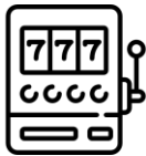
Salones de juego

“Sincronizado con los registros de interdicción al juego”